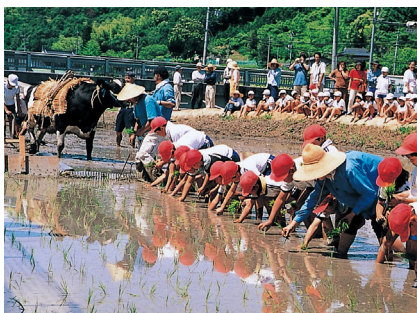
昔ながらの田植えの体験